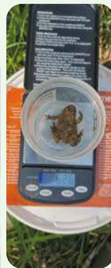
Le protocole CMR