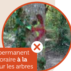
✗ Balisage permanent ou temporaire à la peinture sur les arbres