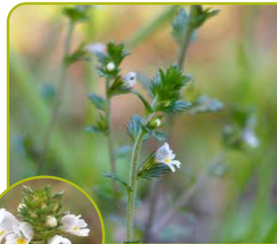
Euphrase des Bois