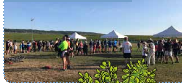
Stand d'inscription - septembre 2020

La création de sentiers VTT permanents qui intègrent les enjeux du site Natura 2000 permet d'augmenter l'offre touristique et sportive , tout en limitant les impacts sur les espèces et les milieux naturels .