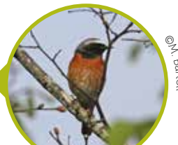
Rougequeue à front blanc

De nombreuses espèces animales sont également présentes sur le site d'Avenay-Val-d'Or, comme le Rougequeue à front blanc . Ce petit passereau insectivore et protégé à l'échelle nationale a été observé cette année !