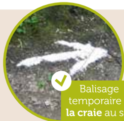
✓ Balisage temporaire à la craie au sol

Pour plus d'infos sur les types de balisages préconisés, contactez-nous : 03 26 59 44 44