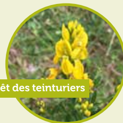
Genêt des teinturiers