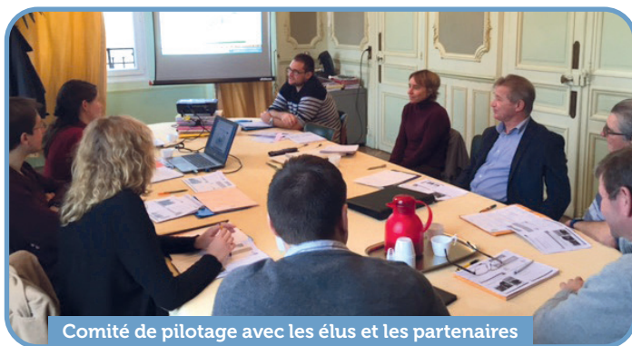
Comité de pilotage avec les élus et les partenaires

Chaque année, les animatrices des sites organisent le Comité de pilotage (COFIL), en présence de Madame la Sous-Préfète, des élus et des partenaires techniques (ONF, CNPF Grand-Est, Conservatoire d'Espaces Naturels de Champagne-Ardenne, RTE...). Ce moment d'échanges permet de faire le bilan sur les actions menées, d'étudier les points de blocages éventuels et de réfléchir à de nouveaux projets.