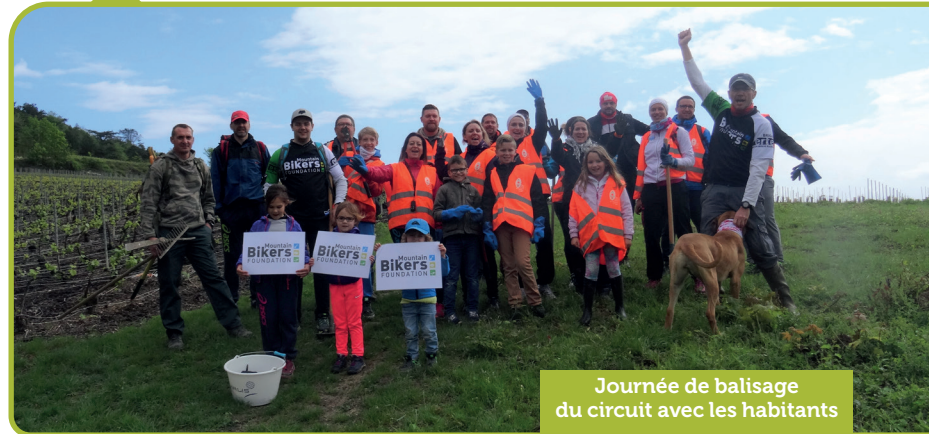
Journée de balisage du circuit avec les habitants

Ce fut un travail mené par le Parc, en partenariat avec l'association Mountain Bikers Foundation et le Relais sport santé nature de Bouzy .