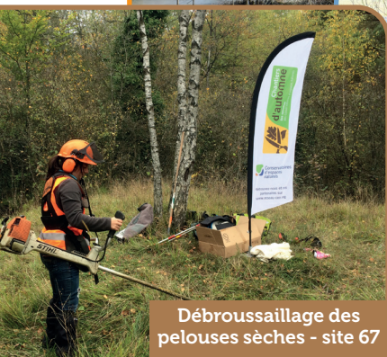
Débroussaillage des pelouses sèches - site 67