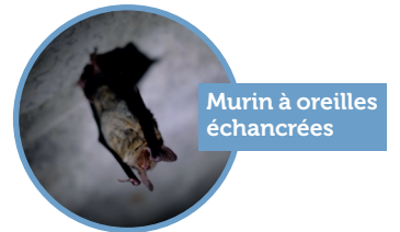
Murin à oreilles échancrées

1 Une compensation financière est versée pour la création d'îlots de vieillissement en forêt, qui sont favorables à la biodiversité forestière et à la bonne fertilité des sols.