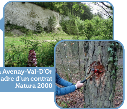
Martelage à Avenay-Val-D'Or dans le cadre d'un contrat Natura 2000

2 Des travaux sont subventionnés pour la restauration de milieux (clairières, landes, mares forestières...).