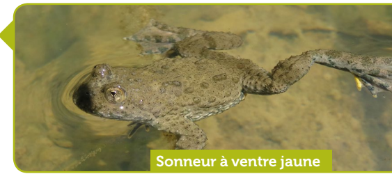
Sonneur à ventre jaune