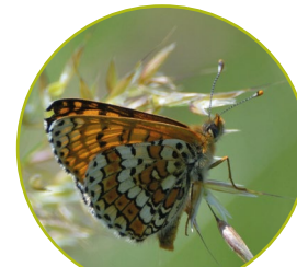
Mélitée des Scabieuses

Sur le site Natura 2000, 36 espèces de papillons de jour ont été recensées sur les pelouses calcicoles.