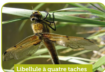
Libellule à quatre taches

La commune a intégré les zones humides et les mares forestières, recensées par le Parc naturel régional, lors du renouvellement de son document d'urbanisme.