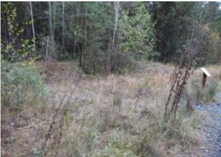
A proximité du panneau sur les zones humides