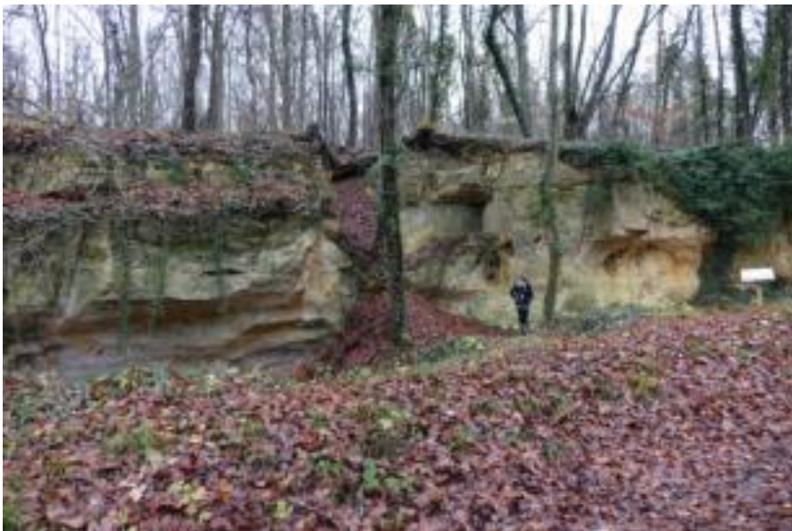
A proximité du panneau sur la beurge