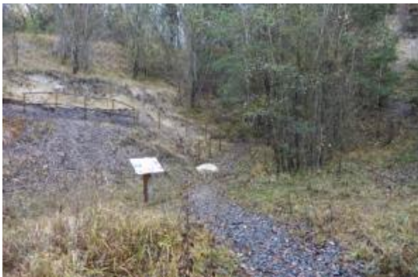
A proximité du panneau sur la lignite

Attention – Une partie du sentier n'est pas accessible en voiture et est très pentue – certains déplacements devront se faire à pied. Il faudra donc envisager l'utilisation de matériaux faciles à transporter.