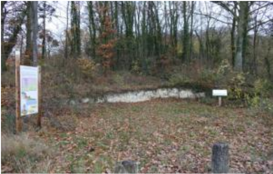
A proximité du panneau sur la craie