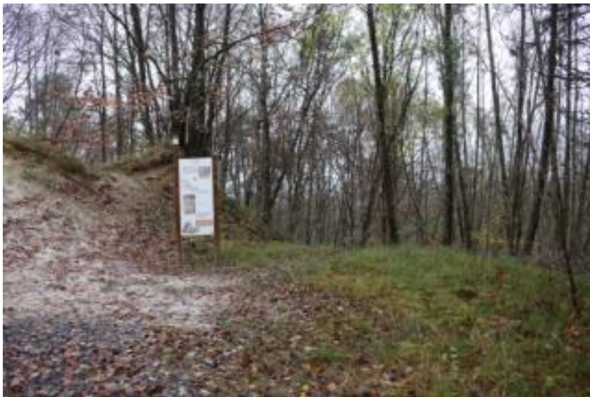
A proximité du panneau sur le sable