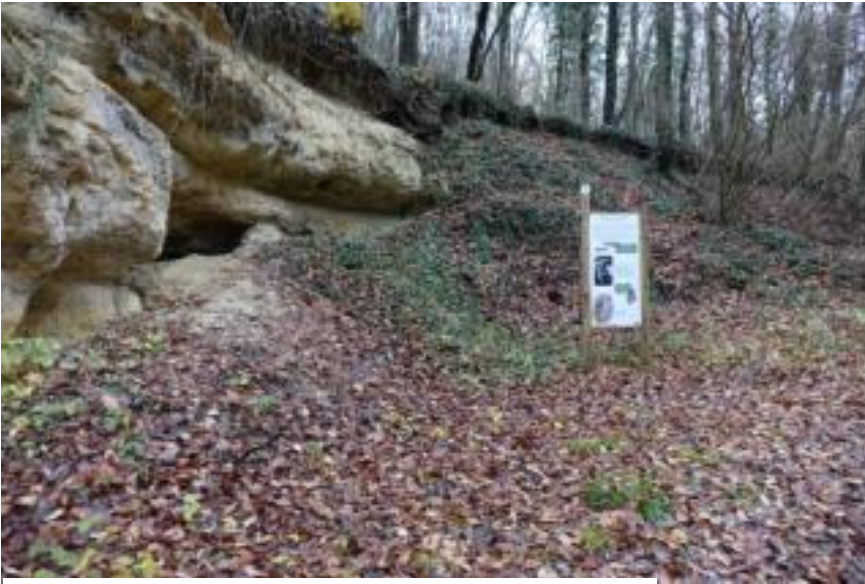
A proximité du panneau chauve-souris